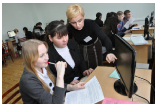
Кабинет компьютерных технологий