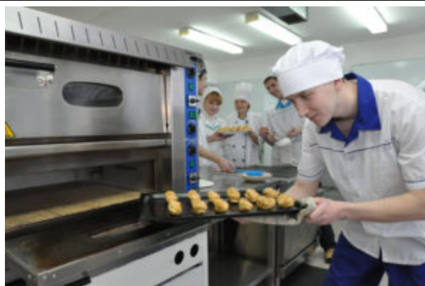
Учебный кондитерский цех Инфраструктурный лист