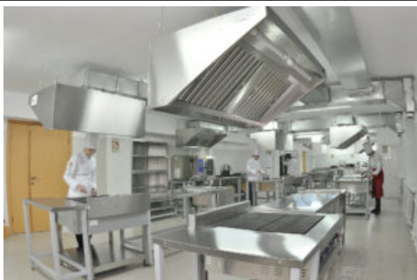
Учебный кулинарный цех Инфраструктурный лист