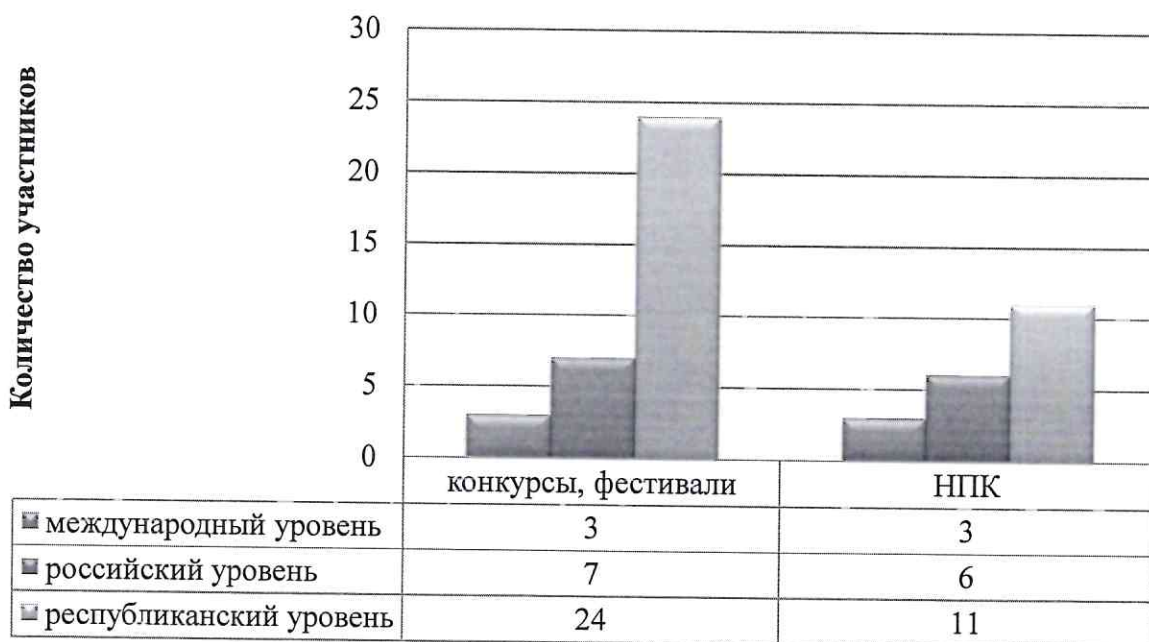
Рисунок 5. Количество педагогов-участников конкурсов, научно-практических конференций, фестивалей

В анализируемый период педагоги Образовательной организации принимали активное участие в конкурсах, научно практических конференциях, фестивалях различного уровня. Из 34 педагогов, участвовавших в конкурсах и фестивалях, 22 стали победителями и призерами данных мероприятий, что составляет 37,93%. Количество педагогов – участников конкурсов, научно-практических конференций и фестивалей представлено на рис. 5.