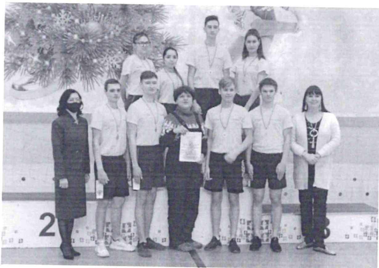
Рисунок 11. Победители Кубка Чувашской Республики и Республиканского турнира «Ёлка в кроссовках» – команда ЧТТПиК