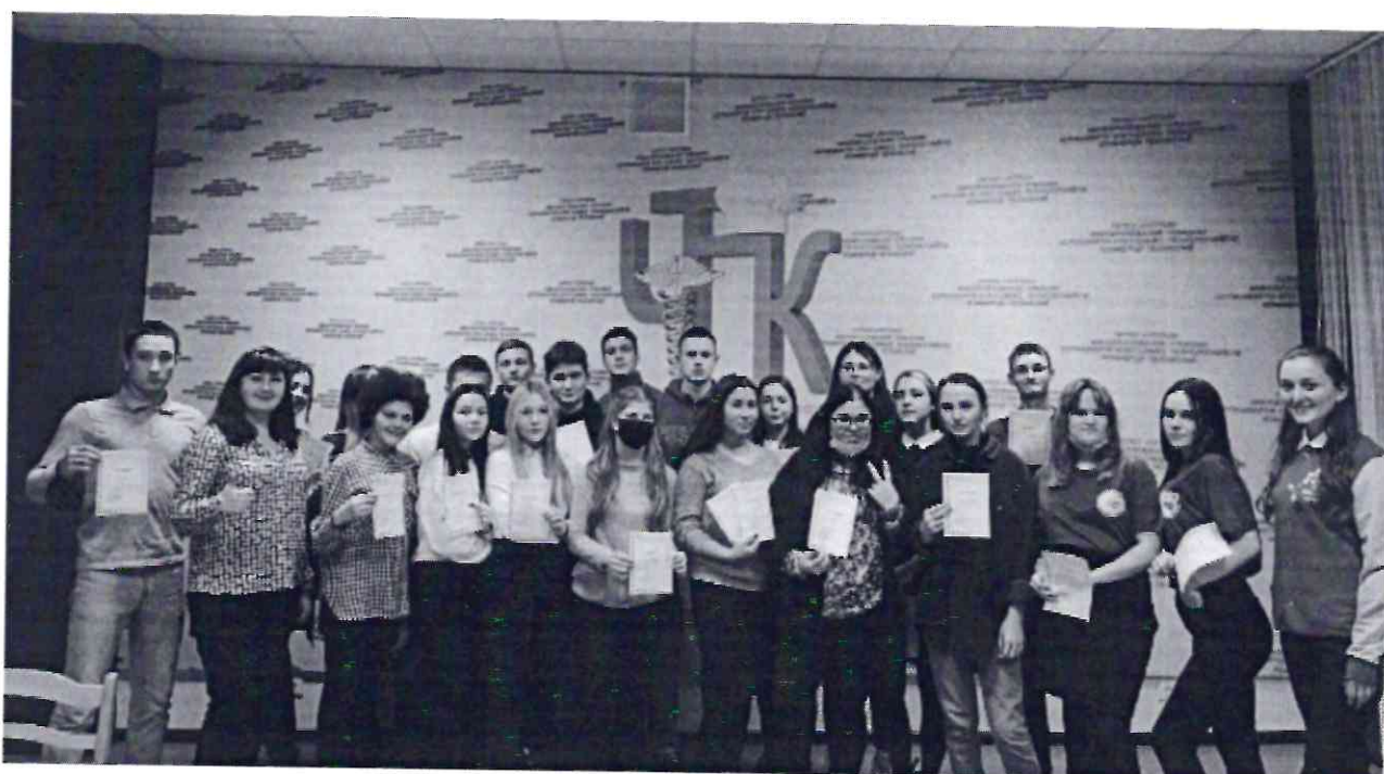
Рисунок 14. Участники Школы волонтеров (добровольцев) «Старт добрых дел»