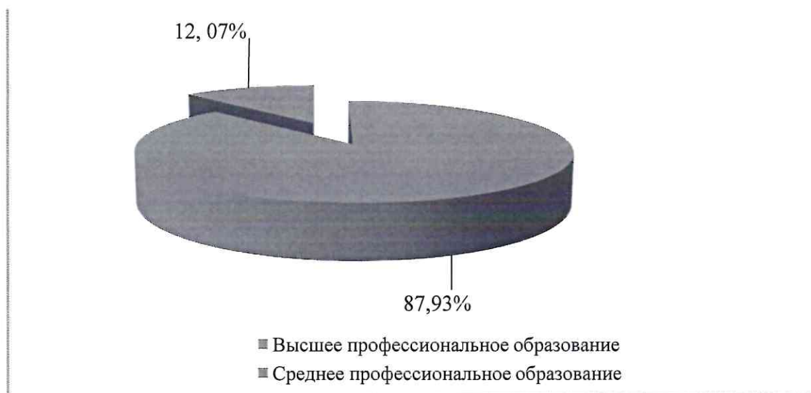
Рис. 2. Соотношения уровня образования педагогов

Доля педагогических работников, имеющих высшее профессиональное образование, составляет 87,9%, из них преподаватели – 100%, среднее профессиональное образование – 12,1% от общего количества педагогов (рис. 2).