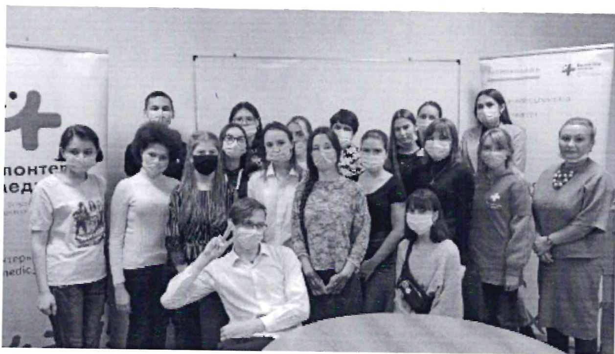
Рисунок 12. Участники Республиканского форума добровольцев (волонтеров) «Доброфорум»