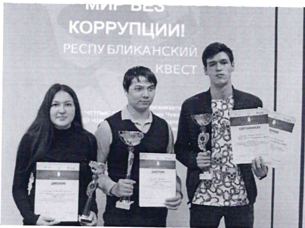
Рисунок 10. Призер Республиканского квеста «Мир без коррупции» – команда ЧТТПиК