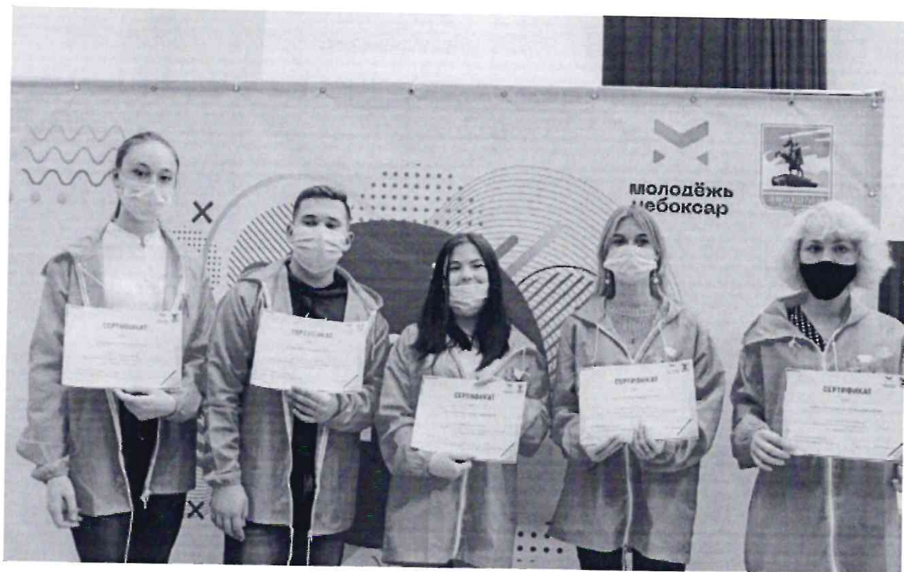
Рисунок 13. Участники Школы молодежного актива «Я – будущий лидер 2021»