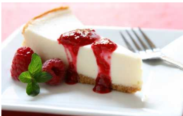
Сладкая жизнь (приготовление чизкейка)