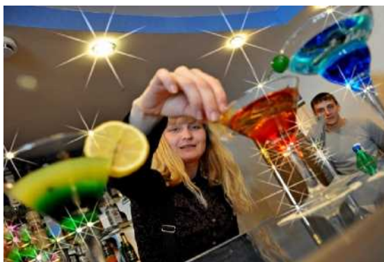
Напитки на все случаи жизни (приготовление безалкогольных коктейлей, лимонадов)