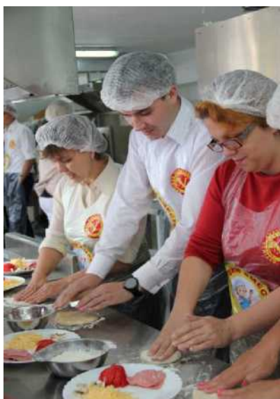
Итальянская кухня (приготовление пиццы)