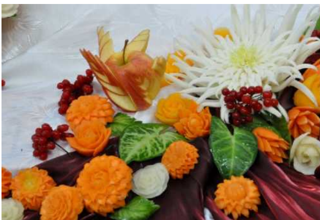
Карвинг (вырезание изделий из овощей и фруктов)