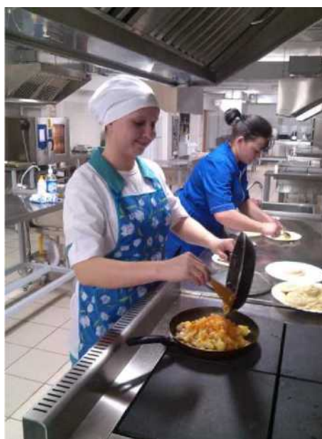
Не просто картошка (приготовление картофельных пирожков с брынзой)