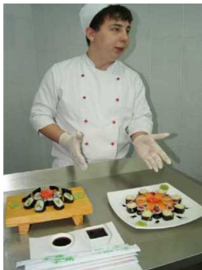
Японская кухня (Приготовление суши, ролов)