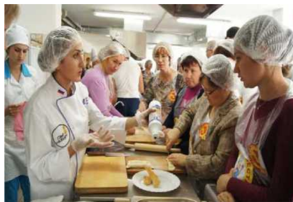
Штрудель, слоики (такое простое слоеное тесто)